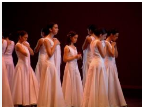
Grupo Al Andalus

Como parte de este proceso de recordar la historia del grupo Al Andalus, revisé muchos documentos y archivos, que quiero compartir con ustedes en la galería de fotos . Quienes llevan más tiempo de estar con nosotros creo que les llegará un sentimiento de nostalgia al mirarlas porque las/los remitirá a muchos recuerdos agradables.